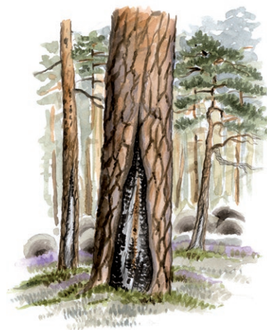
Brandljud kallas spår efter brand på träd.