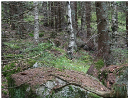
Djupa dalen.