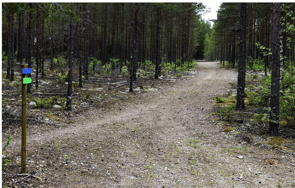
Ridvägen mellan masten och Vargberget.